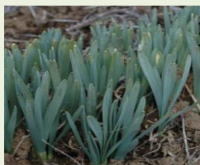
ス イ セ ン