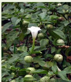
チ ョ ウ セ ン ア サ ガ オ の 葉 と 花