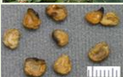
チ ョ ウ セ ン ア サ ガ オ の 種