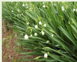
ス ノ ー フ レ ー ク (ス ス ラ ン ス イ セ ン)